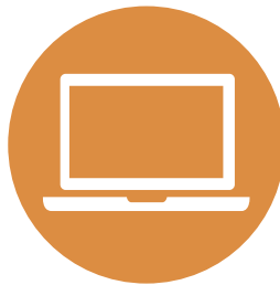
Krav under användning