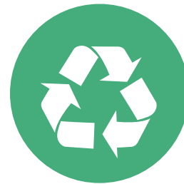
Krav under sluthantering